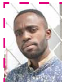
Job IKAMA Critique d'art