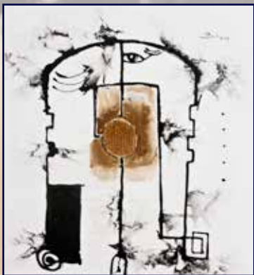
J7 90x80 acrylique, café sur toile 300 000 Fcfa