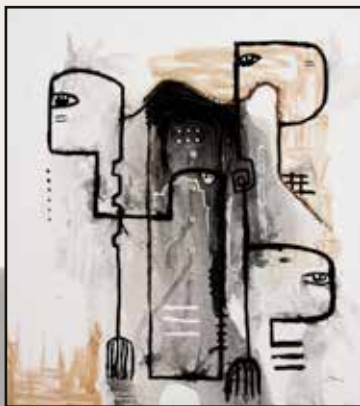
Papa 90x80 acrylique, café sur toile 350 000 Fcfa