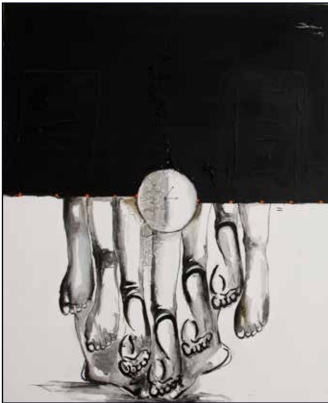
Philosophie 83x73 acrylique 400 000 Fcfa

T o ke Wapi ? Est un cri qu'on lance sous forme d'interrogation et en même temps un cadeau pour toutes ces personnes qui souffrent. « J'aimerais bien peindre des choses plus heureuses, mais ce qui est là est ce que je vois, ce que je vois dans mon pays pour l'instant. Et cela justifie ma motivation ».