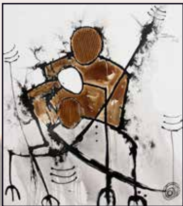
Famille 100x90 acrylique, café sur toile 350 000 Fcfa