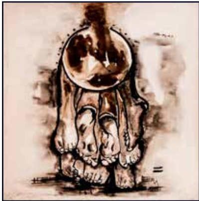
82x92 acrylique, café sur toile 550 000 Fcfa