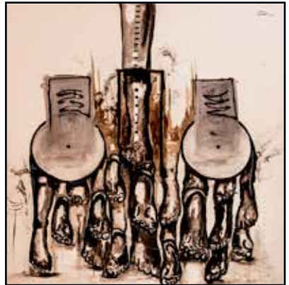
Bonheur 110x100 acrylique, café sur toile 650 000 Fcfa

Ba est un chercheur infatigable de nouvelles ressources pour la composition de ses tableaux. À cette occasion, on découvre dans le café une touche improvisée et légère de la peinture marron.