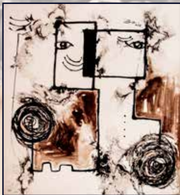
Amour 98x100 acrylique, café sur toile 350 000 Fcfa