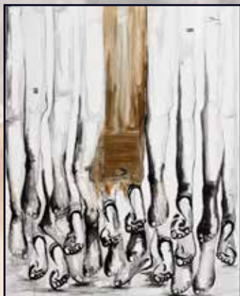
Boni 85x110 acrylique, café sur toile 500 000 Fcfa