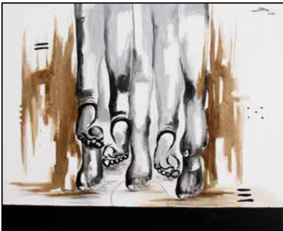
Arc-en-Ciel 81x78 acrylique, café sur toile 225 000 Fcfa