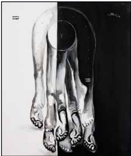
Petit Monde 83x73 acrylique 400 000 Fcfa

Malgré la dureté de leur contenu, les tableaux de Ba montrent la beauté de l'Afrique : sereine, propre et lumineuse. Des toiles presque bicolores dans lesquelles la dualité entre le noir et le blanc parle des choix qu'on réalise dans la vie « dans la vie on peut gagner ou on peut perdre ».