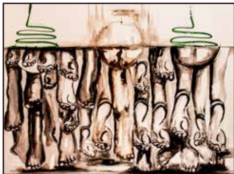
Makambo na Congo 124x110 acrylique, café sur toile 1 000 000 Fcfa