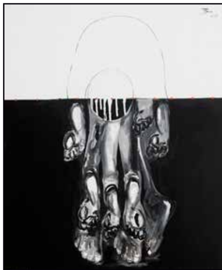
Humanité 78x81 acrylique 400 000 Fcfa