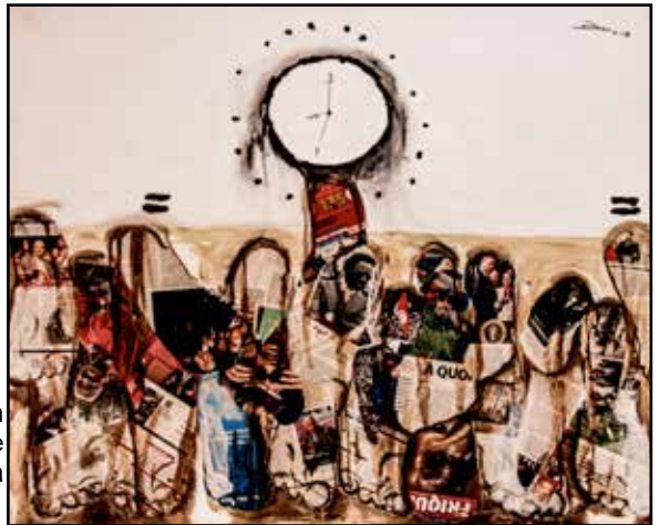
Nom Commun 90x80 acrylique, café sur toile 1 050 000 Fcfa