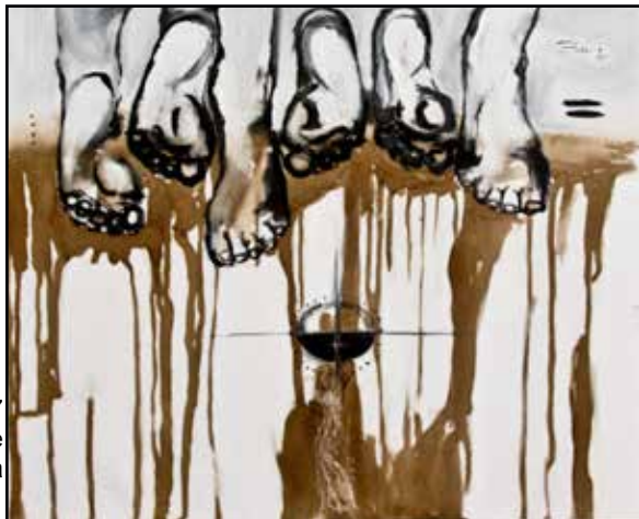
7 36x55 acrylique, café sur toile 225 000 Fcfa