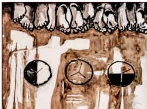
24h/24 82x92 acrylique, café sur toile 450 000 Fcfa

Pieds qui souffrent. Pieds des femmes violées. Pieds d'enfants qui assistent à cette scène. Pieds d'enfants soldats. Pieds des handicapés. Pieds malades. Pieds des vies diminuées par les constantes négligences des autorités. « Les pieds représentent la direction où l'on va. On est en train de courir trop vite sans penser à ce qui est vraiment important. Tout est bouleversé. On est en train de détruire une génération et ça ne s'arrête pas ». To ke Wapi ?