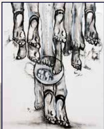
Psaume 85x110 acrylique, café sur toile 500 000 Fcfa