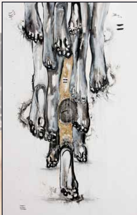
Je Suis La 85x110 acrylique, café sur toile 500 000 Fcfa